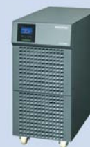
UPS — typ S Bez baterii