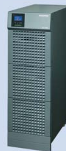
UPS — typ M Z bateriami